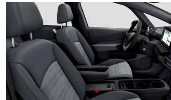
Tygklädsel Fragment | S Platinum Grey XF

ergoActive framstolar (elinställning på båda framstolarna och utdragbara lårstöd), finns som tillval.