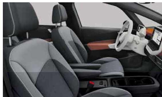
Tygklädsel Flow | T Pro S (Style eller Style Plus interiör. Vit ratt och infotainment) Platinum Grey Safrano Orange XZ