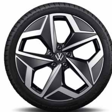
Andoya 19" | T S Pro S