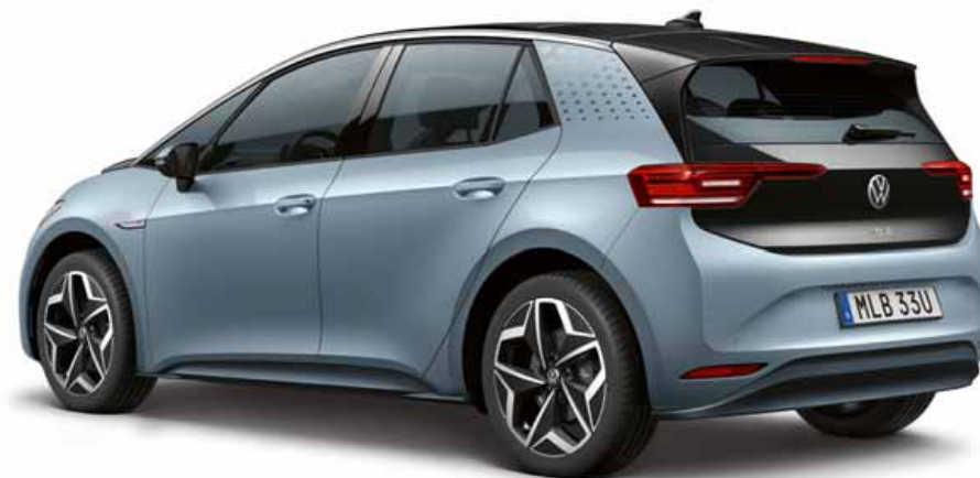
Stonewashed Blue | T Metalliclack