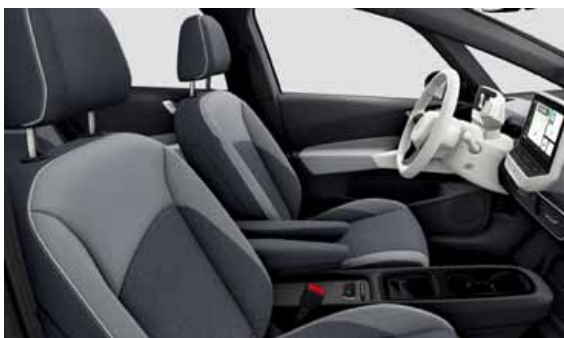
Tygklädsel Flow | T Pro S Style eller Style Plus interiör. Vit ratt och infotainment Platinum Grey XV