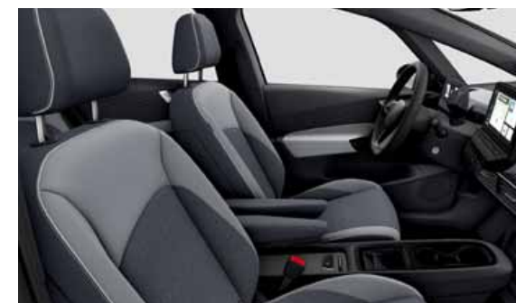
Tygklädsel Flow | S Pro S Style interiör Platinum Grey XF