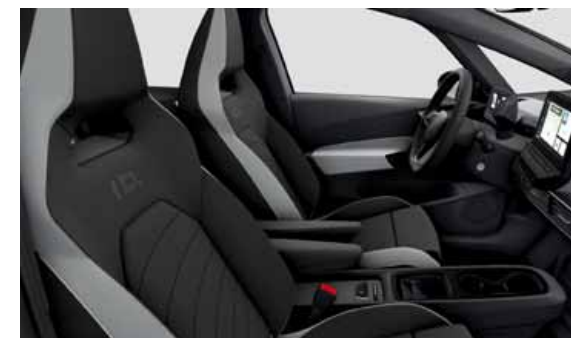
Tygklädsel med sittytor i Art Velours | T Top Sport Plus interiör. Svart ratt och infotainment Soul Black - Dusty Grey Dark - Ceramique/Soul Black LO