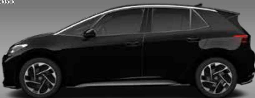
Grenadilla Black | T Metallicklack