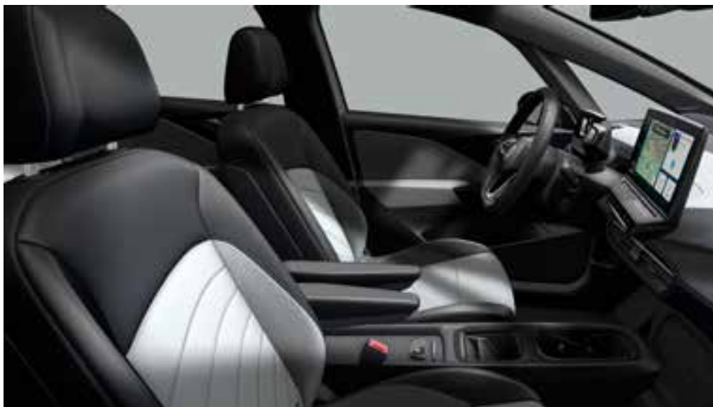
Soul Black-Dusty Grey Dark-Ceramique/Soul Black/Black/Black