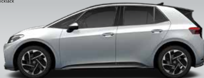
Scale Silver | T Metallicklack