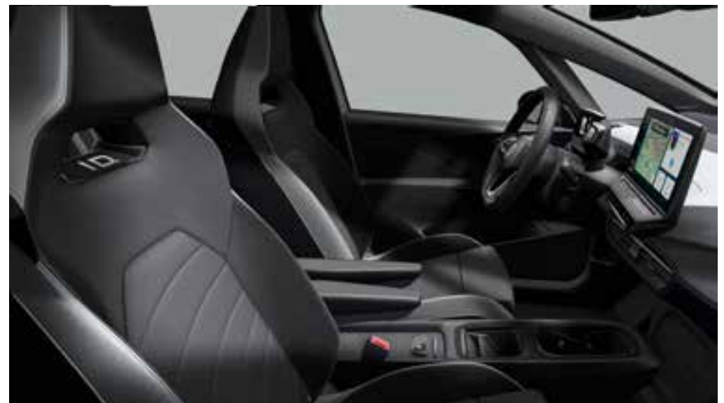
Platinum Grey-Soul Black/Black/Black/Black/Soul Black