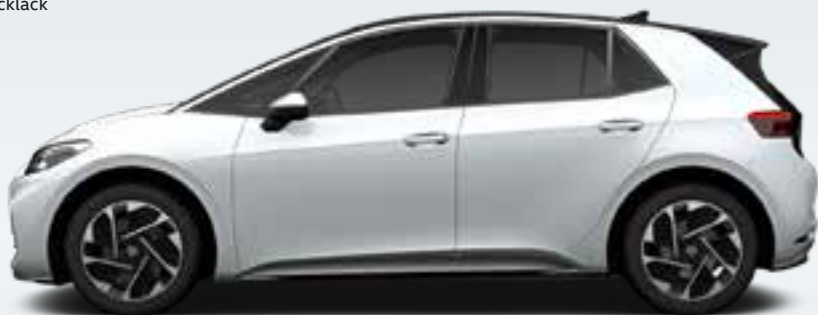
Glacier White | T Metallicklack