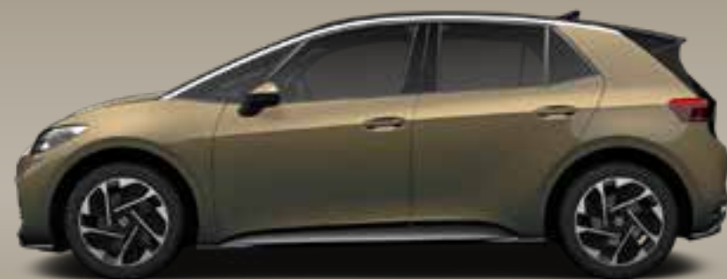
Dark Olivine | T Metallicklack