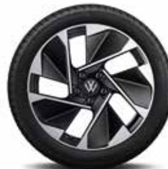
East Derry 18" | S

Lättmetallfälgarna är inte bara vackra att se på utan även formgivna för att skapa en perfekt balans mellan kontroll och kraft.