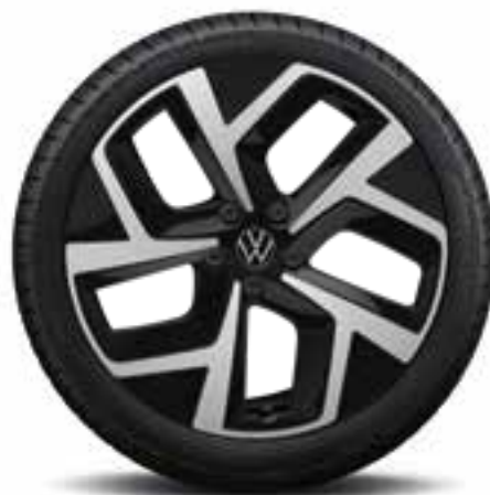
Wellington 19" | T