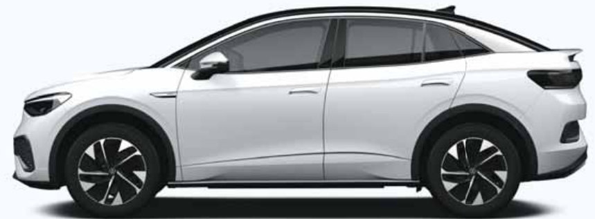
Glacier White | T Metallicklack