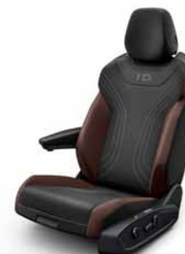
Komfortstol med klädsel Art Velours/ Leatherette på sidostöd, armstöd och dörrsidor