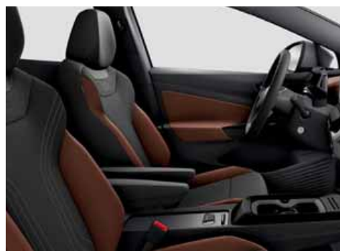
EO Klädsel Art Velours/Leatherette sidostöd, armstöd och dörrsidor