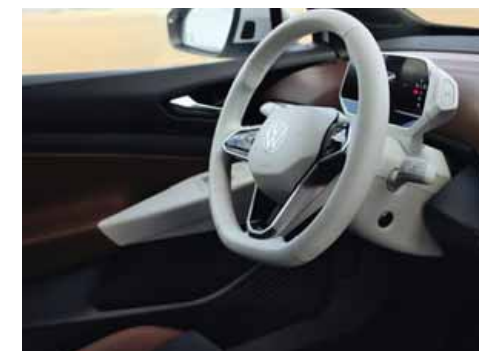
Med Stylepaket och Stylepaket Plus kan man välja vit ratt och vit infotainmentenhet. Ej till GTX.

S Standard T Mot tilläggskostnad - Ej tillgänglig