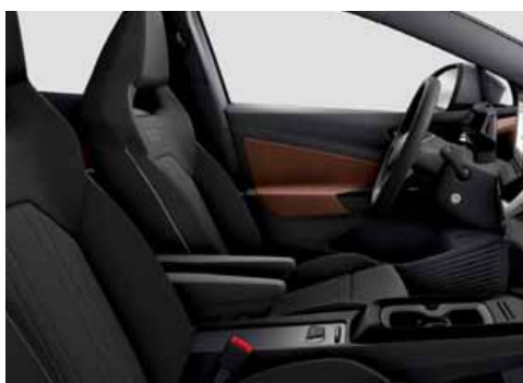
LA Klädsel Art Velours/Leatherette sidostöd, armstöd och dörrsidor