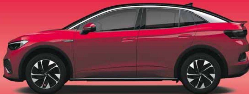
Kings Red | T Metallicklack