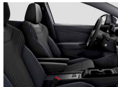
ZK Klädsel Art Velours/Leatherette sidostöd, armstöd och dörrsidor