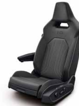
Klädsel textil med röda sömmar/ Leatherette på sidostöd, armstöd och dörrsidor