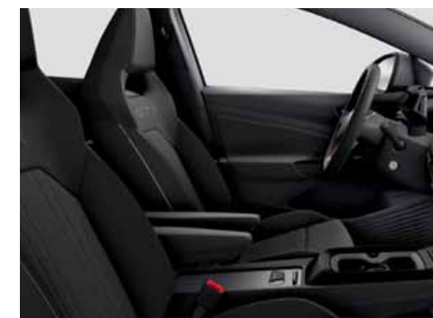
UG Klädsel Alcantara/Leatherette sidostöd, armstöd och dörrsidor (tillval)