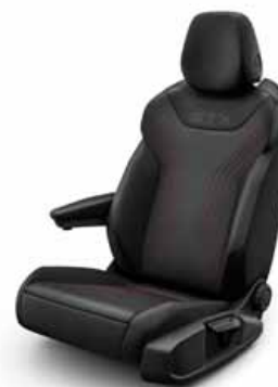
Klädsel textil med röda sömmar/ Leatherette på sidostöd, armstöd och dörrsidor