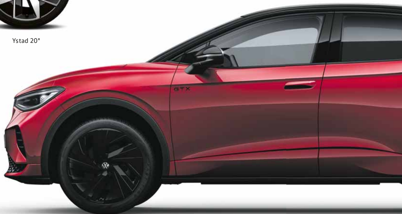
Narvik 21" blanksvarta

S Standard T Mot tilläggskostnad - Ej tillgänglig