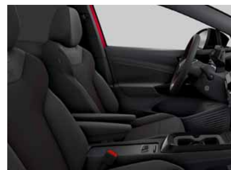
UG Klädsel Art Velours/Leatherette sidostöd, armstöd och dörrsidor