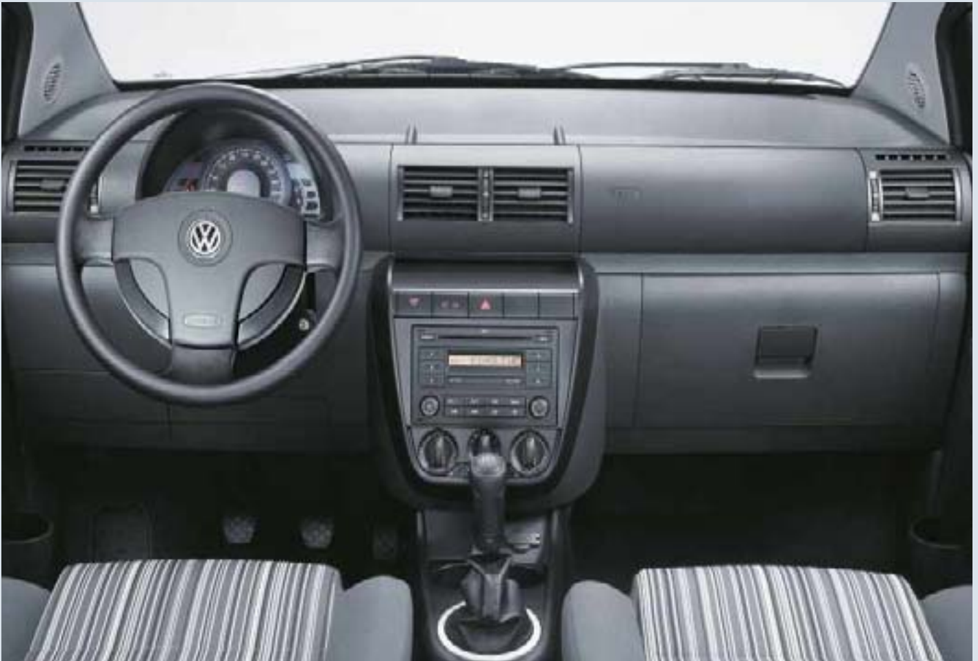
Förarmiljö med tygklädsel "Stripes".