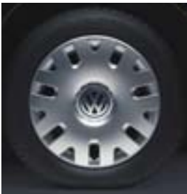
Stålfälg 14" med hjulsidor.