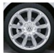
"Vera Cruz" 18"