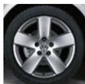
"Monte Carlo" 17"