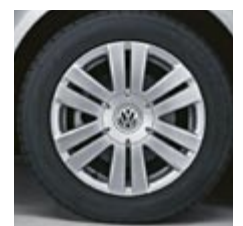
Lättmetallfälg "Adelaide" 16"