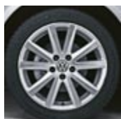
"Le Mans" 17"