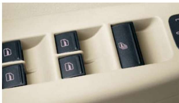
Elektriska fönsterhissar fram och bak, med central manövreringsknapp.