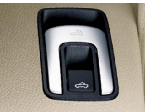
Nercabatt på 25 sekunder.