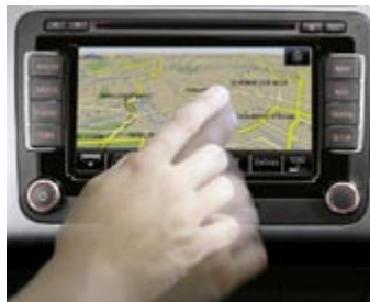
Radio/navigationssystem med pekskärm.