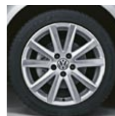
Lättmetallfälg "Le Mans" 17" (standard V6)