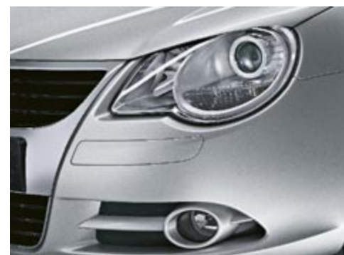
Halogenstrålkastare och dimstrålkastare fram.