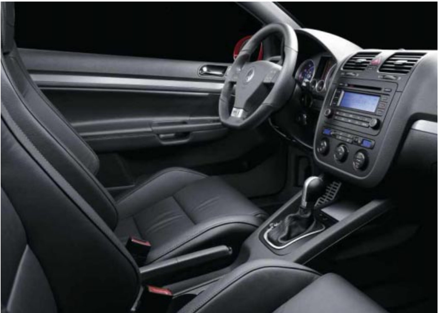
Bilden visar läderklädsel, 2-zons klimatanläggning samt DSG-växellåda, som är tillval.