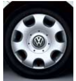
Stålfälg 16" med hjulsida i plast.