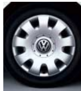
Stålfälg 15" med hjulsida i plast.