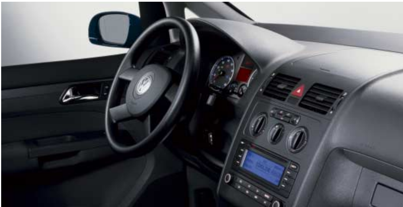
Bilen på bilden är extratrustad.