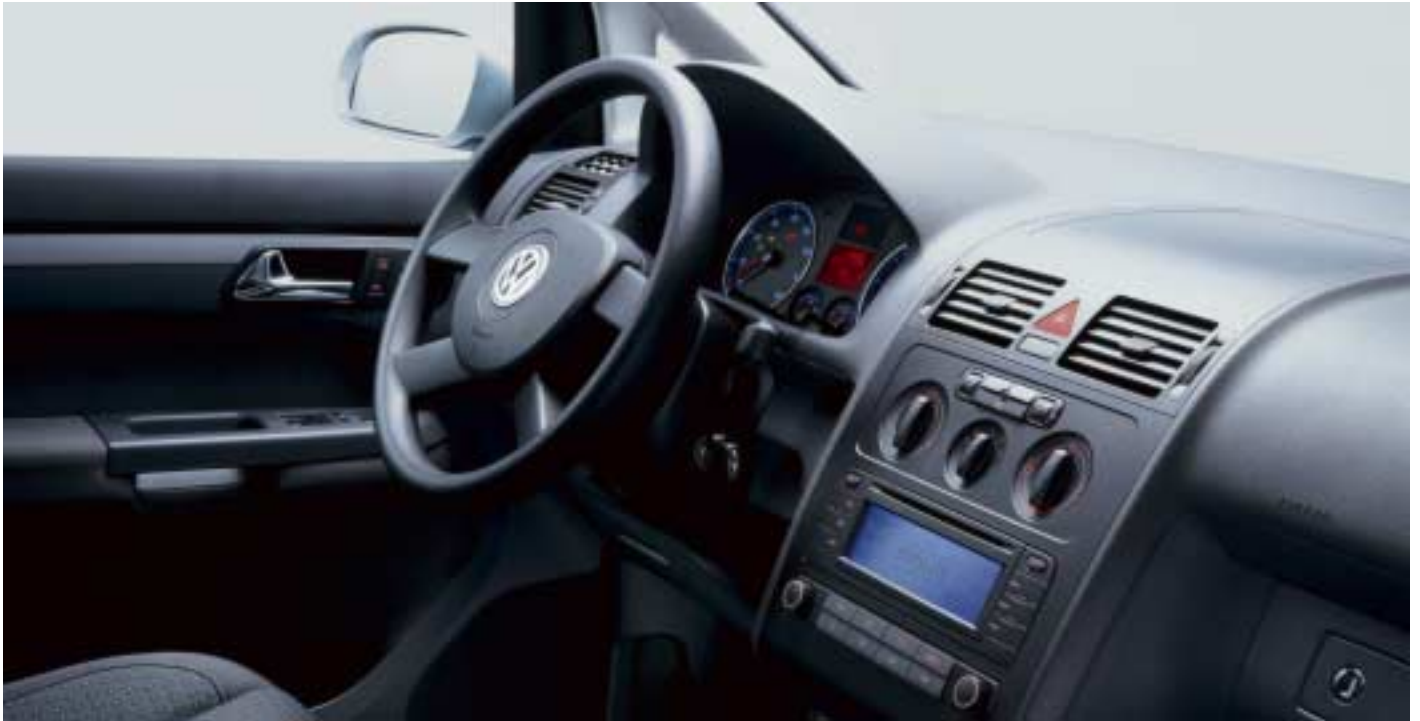
Bilen på bilden är extrautrustad.

Standard för TDI 136. Tillval till 1,6 FSI och TDI 100.