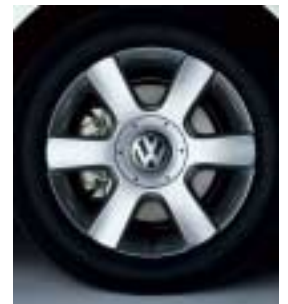
Lättmetallfälg 16" "Hockenheim".