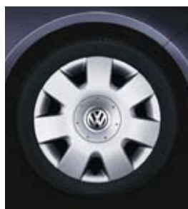
Stålfälg 14" med hjulsida i plast.