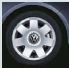
"Sao Paolo" 14"