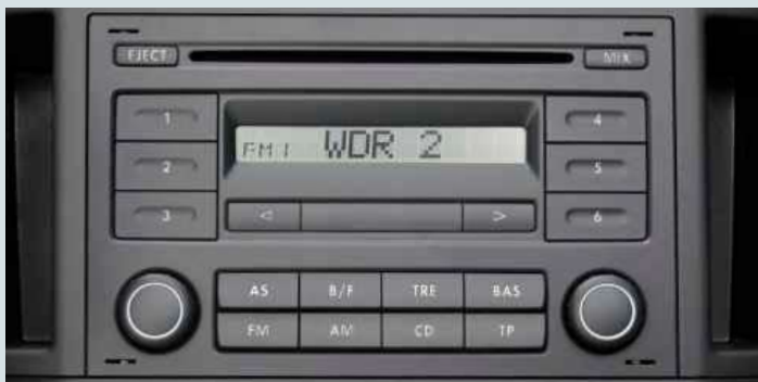
RCD 200 med 4 eller 8 högtalare.