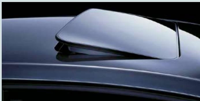
Elsollucka i glas.