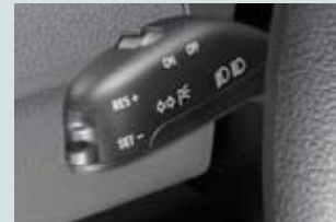
Farthållare (ej 1,2).