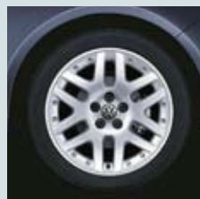
"San Marino" 16"