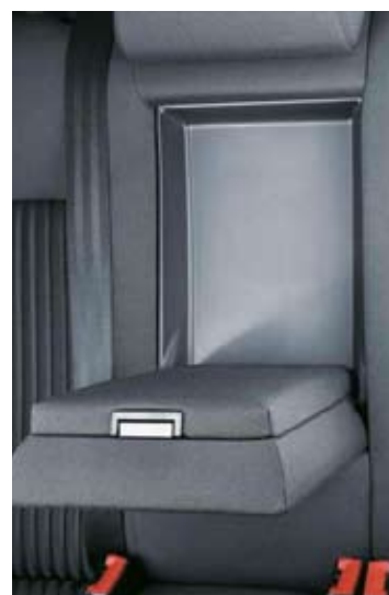
Mittarmstöd i baksätet.