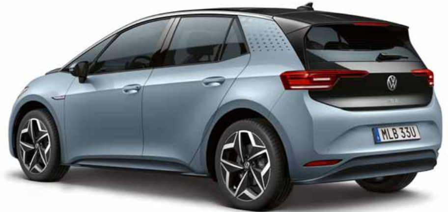
Stonewashed Blue | T Metalliclack