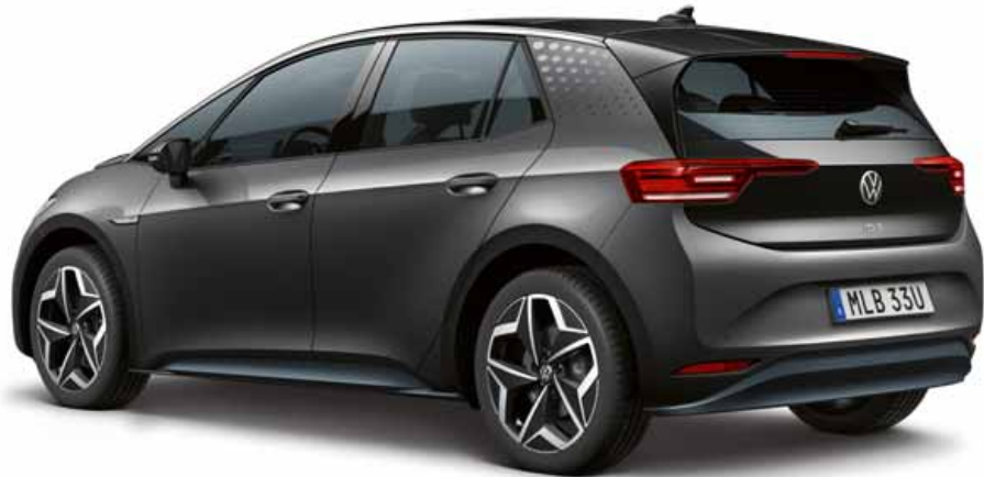
Mangan Grey | T Metalliclack