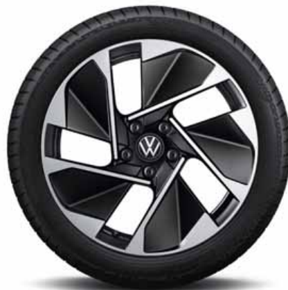
East Derry 18" | S