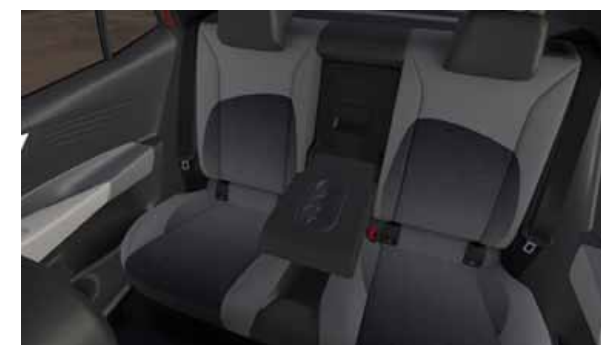
Mittarmstöd och genomlastningslucka