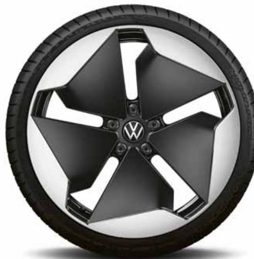
Sanya 20" | T