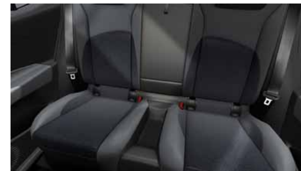
Två sittplatser i baksätet.