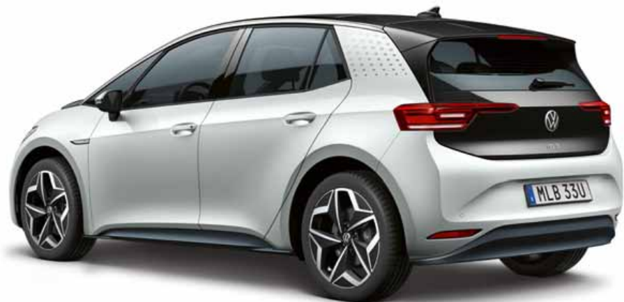
Glacier White | T Metalliclack